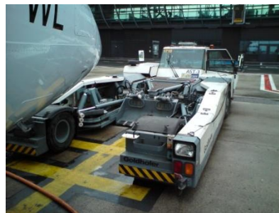
Push sans barre