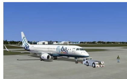
Push avec barre (par défaut dans Fsx)